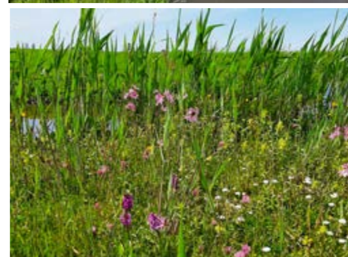
Voorbeelden van natuurvriendelijke oevers, met naast veel andere soorten veel brede orchis en moeraskartelblad.