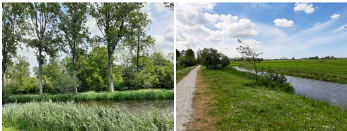
De randen van Maasland hadden voorheen voornamelijk dit beeld. Dichte bosschages met veel exoten. Populierenlanen met beschaduwde en weinig soortenrijke bermen.

De randen van Maasland waren voorheen "klassiek" ingericht met "gemeentegroen". Het groen was eentonig en het buitengebied was niet beleefbaar. Nu zijn de randen geopend en ingericht met natuurlijk groen. Bloemrijke bermen met hier en daar een klein bosje, boom of struik.