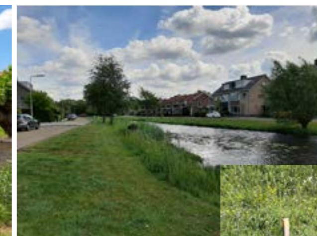
Binnen de woongebieden zijn ook natuurvriendelijke oevers aangelegd. Vaak een combinatie wild met gazon. Simpele paaltjes vertellen de maaier tot waar hij mag komen.